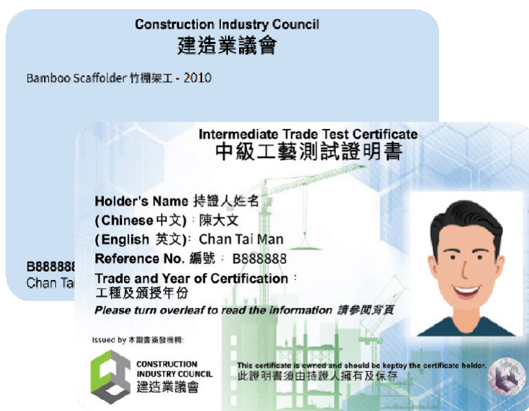
「中级工艺测试」（俗称「中工」）证明书样本