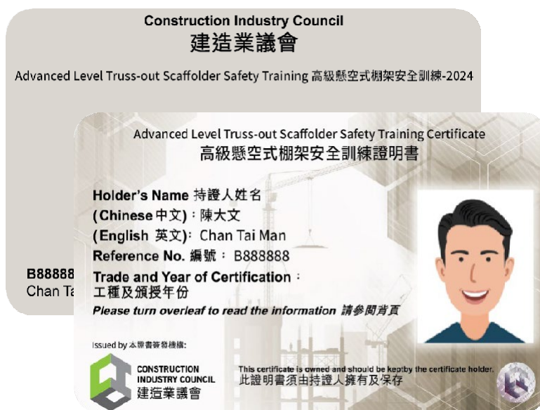
「高级悬空式棚架安全训练」证明书