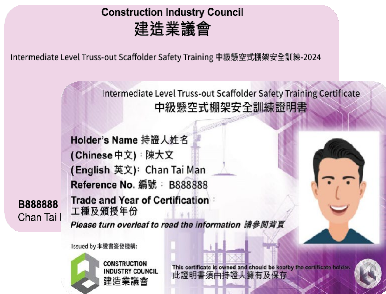
「中级悬空式棚架安全训练」证明书样本