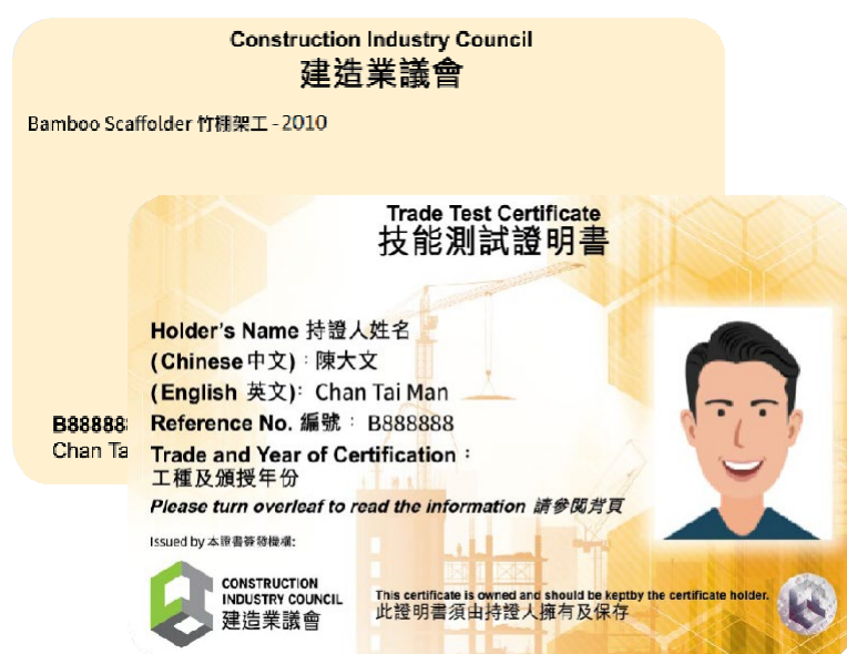
「技能测试」（俗称「大工」）证明书样本