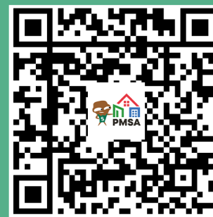
「物管業應如何推行垃圾收費」專題網頁

為協助物管業界做好垃圾收費的準備部署，物業管理業監管局已於網站增設「物管業應如何推行垃圾收費」專題網頁，並會定期作出更新，為業界提供最新相關資訊，包括就垃圾收費的常見問題與環境保護署聯合製作培訓資料及工具包。